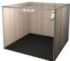
Stand sans angle